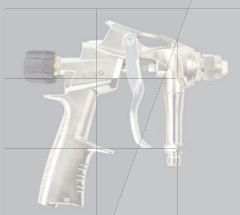
Pistolet pulvérisateur MT Pistolet pulvérisateur métal, réglable ART-N°: WSP-MT