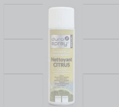
Nettoyant Citrus Aérosol de nettoyant pour buses ART-N°: CANAR85-A500_FR