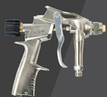
Pistolet pulvérisateur MT Pistolet pulvérisateur métal, réglable ART-N°: WSP-MT