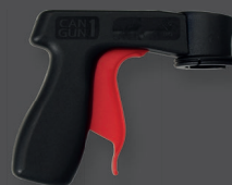
Poignées d'aérosols Facilite l'application de colle ART-N°: WSP-AG