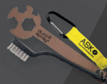
Tool-Set Kit d'accessoires entretien ART-N°: ZUBES3K