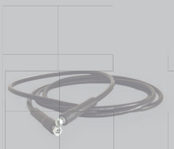
Tuyau, flexible longueur 4 m ou 8 m ART-N°: WSS400/ WSS800